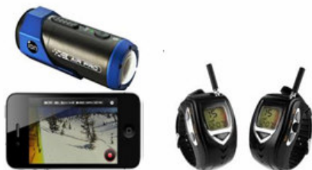
數位影音無線對講機