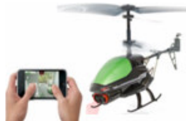
影音無線遙控飛機/遙控車